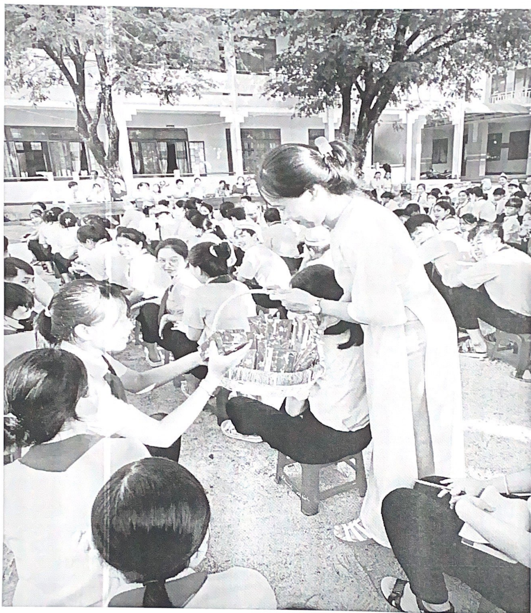
Học sinh tích cực tham gia hoạt động

Đã đẩy mạnh ứng dụng công nghệ số trong tổ chức các hoạt động chăm sóc và giáo dục học sinh; CB, GV, NV trong trường đều tích cực tham gia các khoá học trực tuyến ... trong đó lồng ghép, giới thiệu các nội dung học tập, các bài học và học liệu phù hợp với từng nhóm đối tượng người học, thông qua các phần mềm trực tuyến (Zoom, Google Meet, ...).