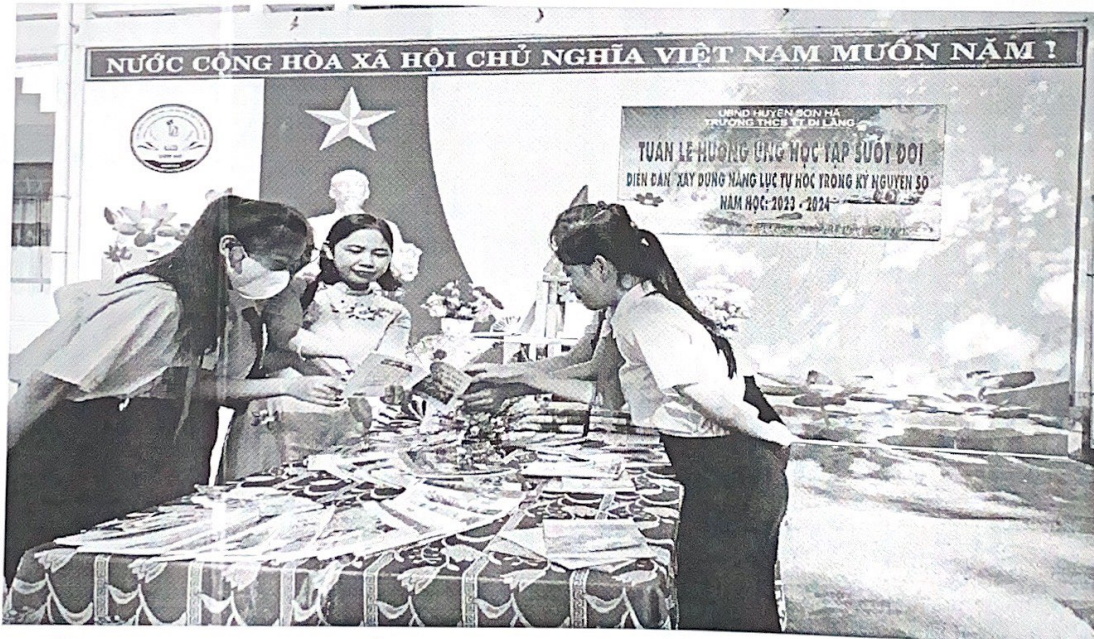
GV hướng dẫn học sinh tìm hiểu thông tin trong sách

+ Thành phần: Toàn thể cán bộ, giáo viên, nhân viên, ban đại diện CMHS và tất cả học sinh trong nhà trường.