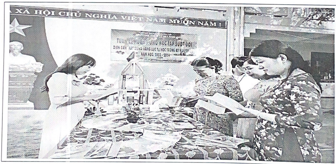
GV tìm hiểu thông tin sách, báo

- Thường xuyên trao dồi cho mình những kiến thức về các lĩnh vực bằng cách tích cực tham khảo các tư liệu, tài liệu sách báo trên các phương tiện truyền thông, tham gia các lớp đào tạo... để tích lũy thêm cho mình kinh nghiệm sống và năng lực chuyên môn.